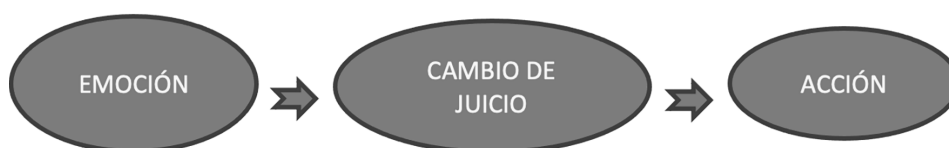
FIGURA 1. Efectos de la emoción según Aristóteles (elaboración de la autora).

Estos serían, entonces, los tres estadios que se pueden abstraer de la obra aristotélica, aquí presentados en forma de ilustración para su mejor comprensión: